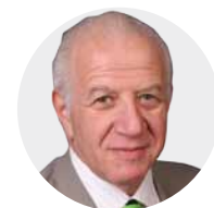
Donald Feinberg, VP Distinguished Analyst Gartner do Gartner

Uma mudança fundamental está a caminho. De BI para Inteligência Artificial. De informar massas para proporcionar momentos. Dos nossos dados para todos os dados. A necessidade de Data & Analytics é generalizada - sustentando todos os modelos de negócios, todas as missões do serviço público e até mesmo nossas vidas pessoais. Ao contrário de outros ativos, o valor de Data & Analytics não se esgota quando consumido. Os dados podem e devem ser usados para uma infinidade de propósitos. Temos uma oportunidade sem precedentes e a responsabilidade de expandir criativamente nossa base de dados e acelerar a descoberta de analytics. Para realizar essa tarefa, os líderes de Data & Analytics devem dominar quatro dimensões-chaves de escala: diversidade, evangelização, complexidade e confiança.